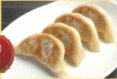
焼きギョーザ(4ヶ) 650円