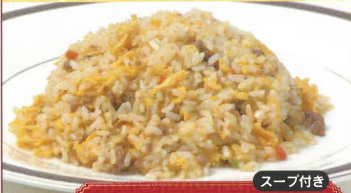
スープ付き 特製チャーハン 1,100円