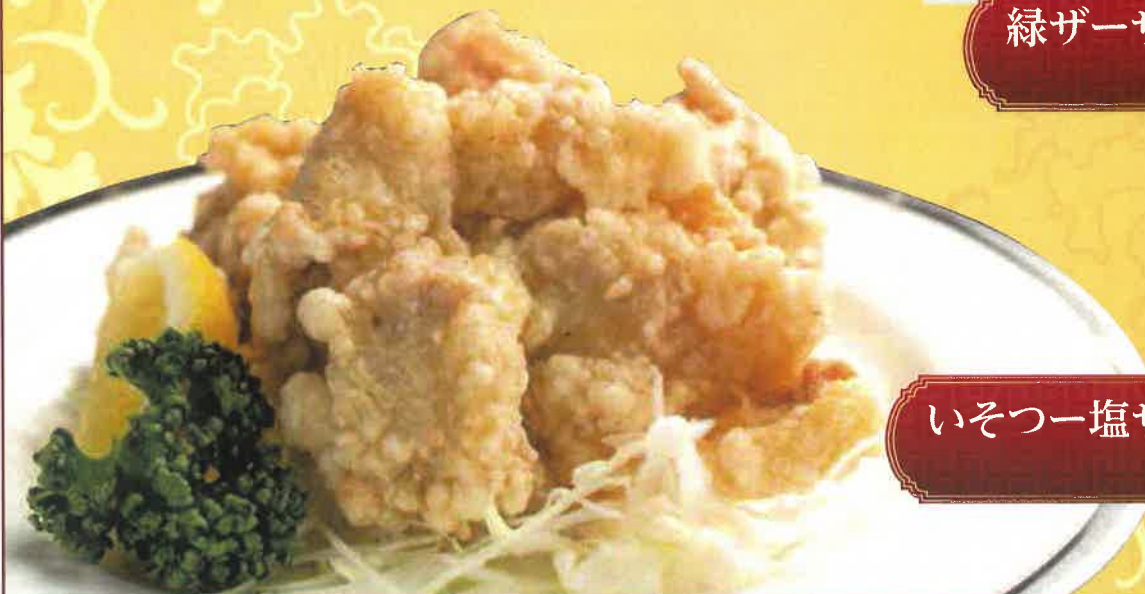
いそつー塩ザンギ(4ヶ) 1,000円