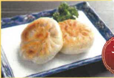
ニラギョーザ(2ヶ) 380円