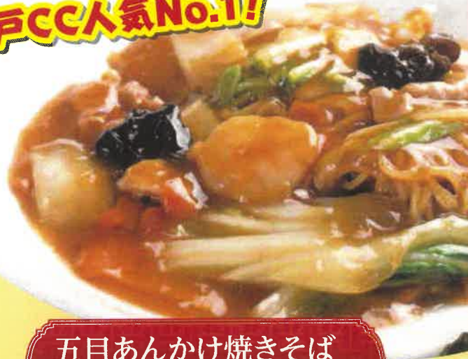
五目あんかけ焼そば 1,600円