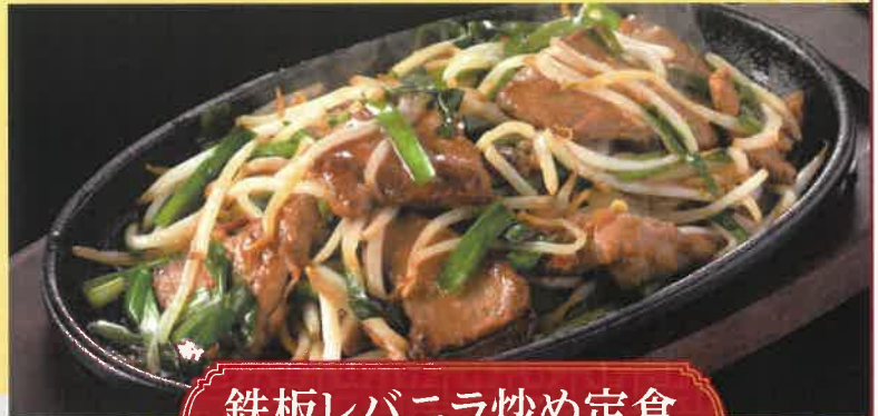
鉄板レバニラ炒め定食 1,700円