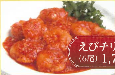
えびチリ定食 (6尾) 1,700円